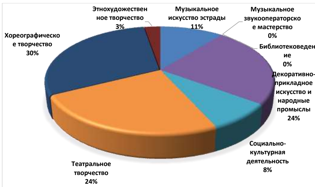
Рисунок 2 - Структура численности обучающихся по очной форме обучения по договорам об оказании платных образовательных услуг, %

Содержание и организация образовательного процесса по каждой специальности определяется программами подготовки специалистов среднего звена.