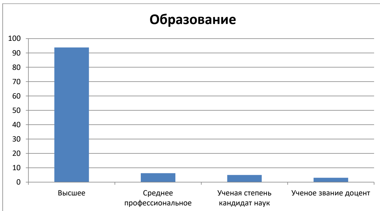
Рисунок 3 – Распределение педагогических работников колледжа по уровню образования, в %

деятельность на основе соответствующего образования, педагогического мастерства и опыта. Деятельность по управлению кадровым составом, влияющим на качество образовательного процесса колледжа, включает: процесс аттестации педагогических кадров, повышения квалификации и переподготовку преподавателей. Качественные показатели по уровню образования педагогических сотрудников ГБПОУ «Пензенский колледж искусств» представлены на рисунке 3.