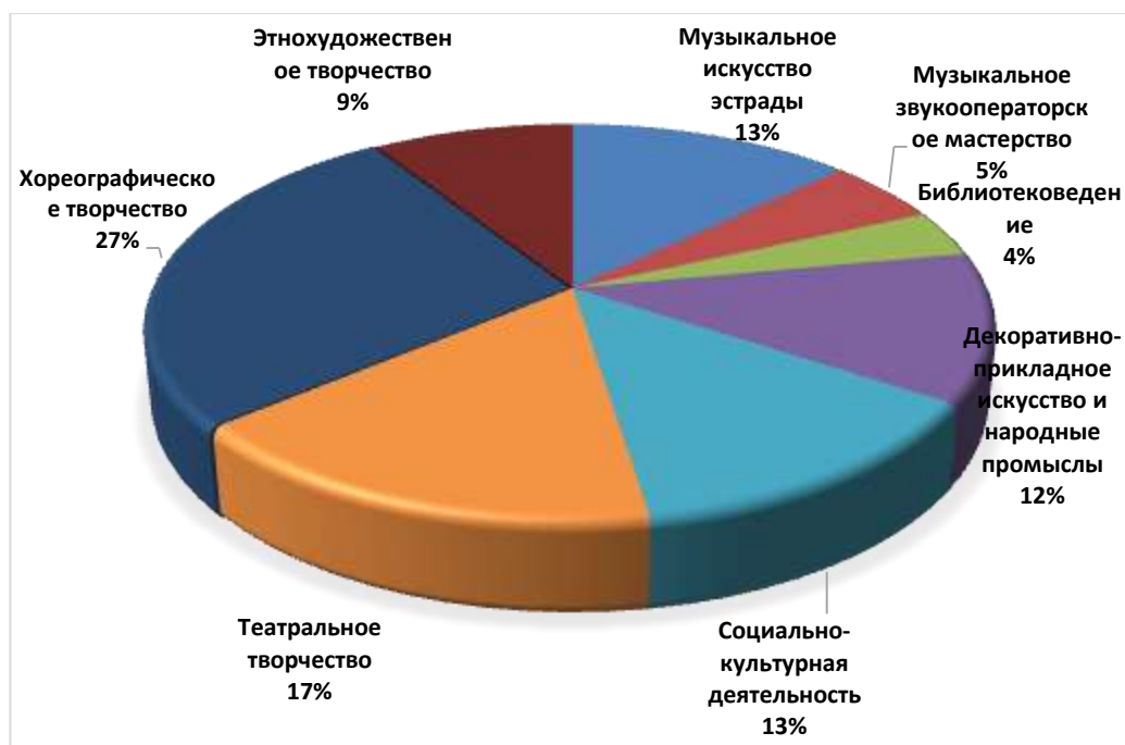
Рисунок 1 - Структура численности обучающихся по очной форме обучения за счет бюджетных средств, %

Структура численности обучающихся по очной форме обучения за счет бюджетных средств приведена на рисунке 1.